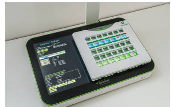
Optional verwendbar beim easyblast® fill2light. Jedes Medikament ist einzeln auf den Belegfotos zu sehen.