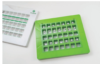
6. Nochmalige Überprüfung der Zusammenstellung der Medikamente.