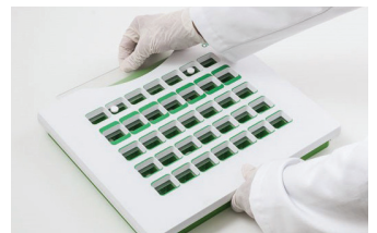
4. Tabletten fallen in die Blistereinsätze. Schließen und den Vorgang wiederholen.