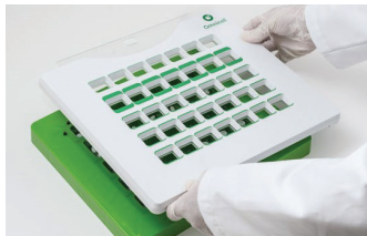
5. Nach der Befüllung das safety modul vom Lochbrett heben.