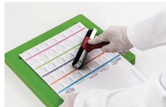
7. Blisterkarte aufkleben und versiegeln.