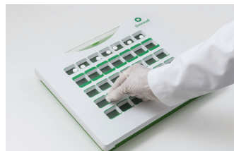
2. Erstes Medikament einfüllen.