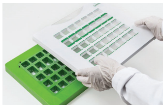
1. safety modul auf das Lochbrett legen.